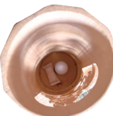
上部から見た竹灯籠

び、切倒した1本から長さ2mくらいの長さに切りそろえて、自動車に積込み家まで運びます。足元も不安定で良くないし、80歳を超えた今ではとても重労働なんです。勿論、切倒した竹は持ち帰り、自宅の塀や外回り材料として使うんですよ。」と言われます。山から取ってきた竹はしばらく乾燥させ、その後、節と節の間をノコギリで切断、竹筒のピースにしてナタで薄く切り、楕円形に加工されます。