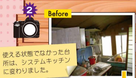
使える状態ではなかった台所は、システムキッチンに変わりました。