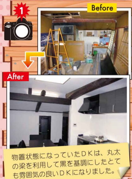
物置状態になっていたDKは、丸太の梁を利用して黒を基調にしたとても雰囲気の良いDKになりました。