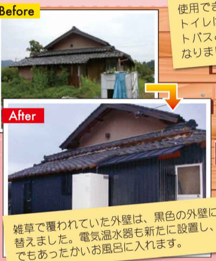
雑草で覆われていた外壁は、黒色の外壁に張り替えました。電気温水器も新たに設置し、いつでもあったかいお風呂に入れます。

使用できなかったお風呂とトイレは、お洒落なユニットバスと水洗式のトイレになりました。