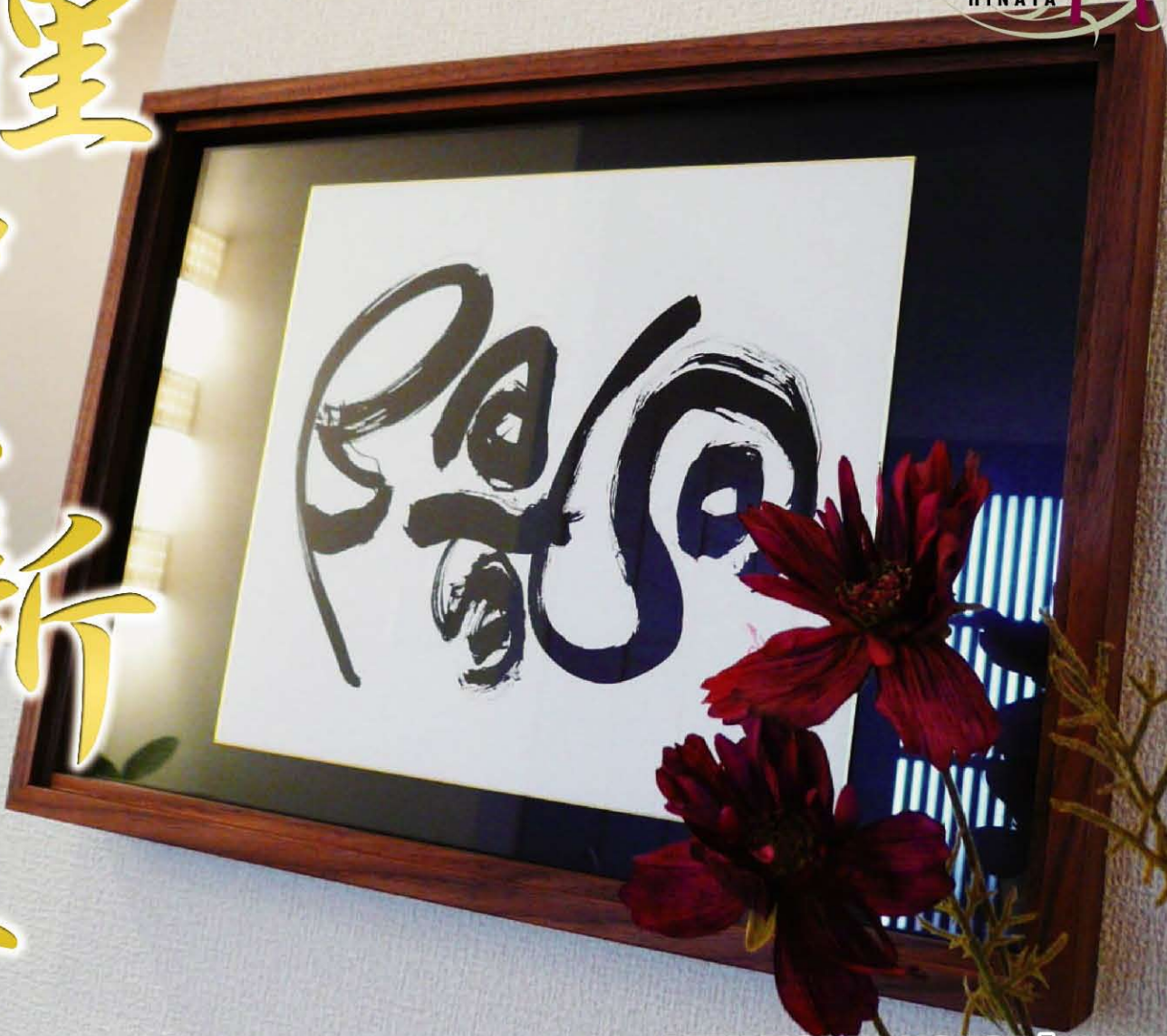
NEW MODEL HOUSE「HINATA」